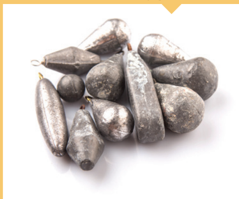
⊘ Artículos de caza y pesca