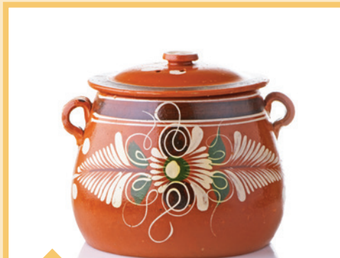
⊘ Cerámica con glaseado de plomo