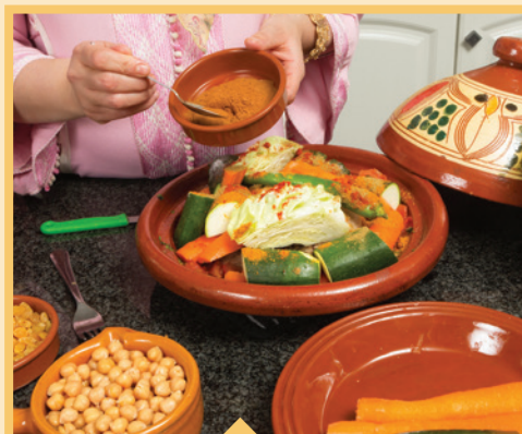
⊘ Especies importadas