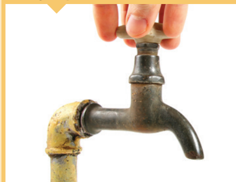
⊘ Tubería de plomo y agua potable