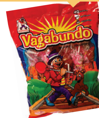
⊘ Dulces importados