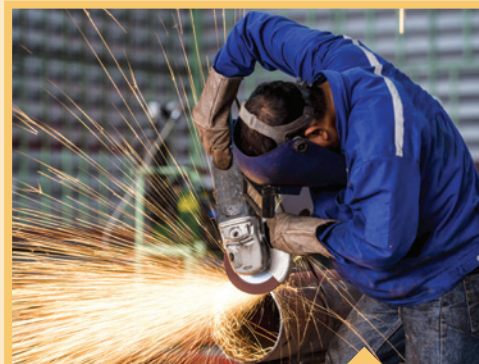
⊘ Trabajadores expuestos al plomo