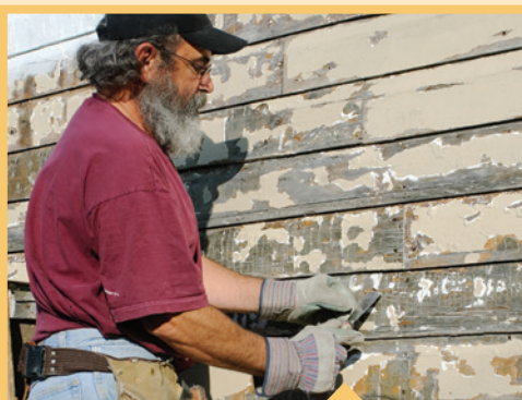
⊘ Reparaciones inseguras de su hogar