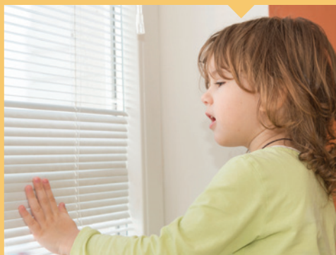
⊘ Mini-persianas de vinilo o plástico