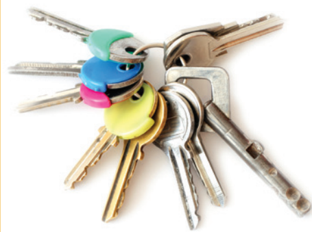
⊘ Llaves de la casa y el carro