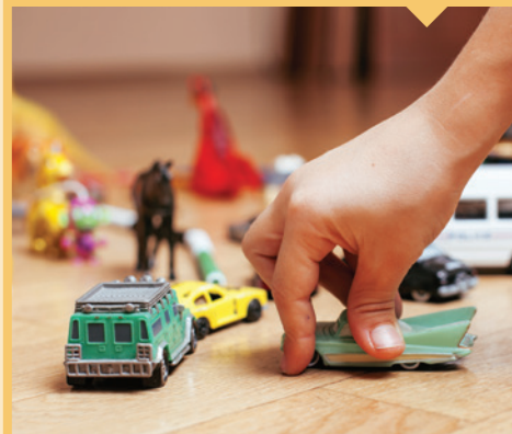
⊘ Juguetes y joyería de juguete